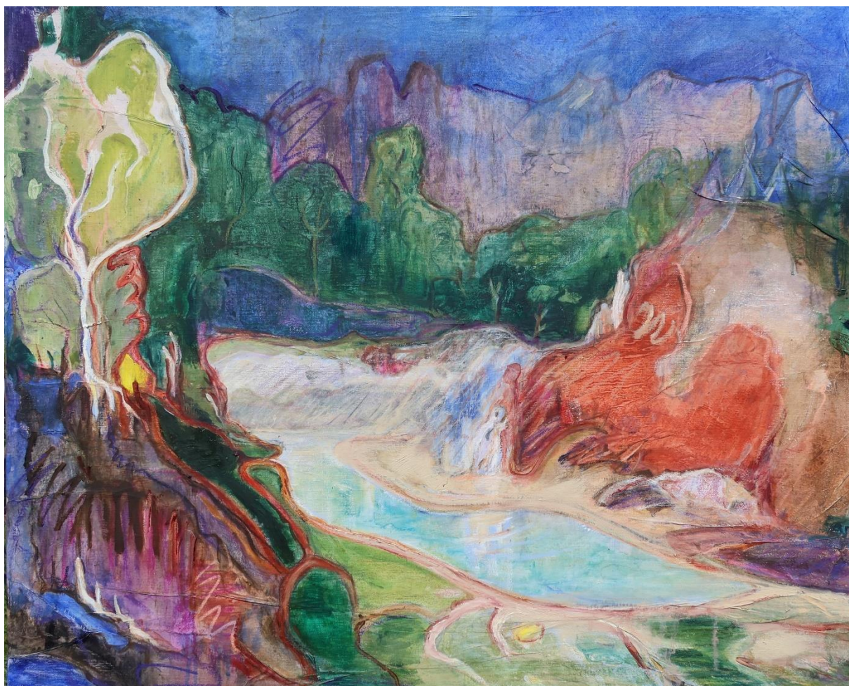
A la Frontière, 2023, huile sur toile, 85x70 cm