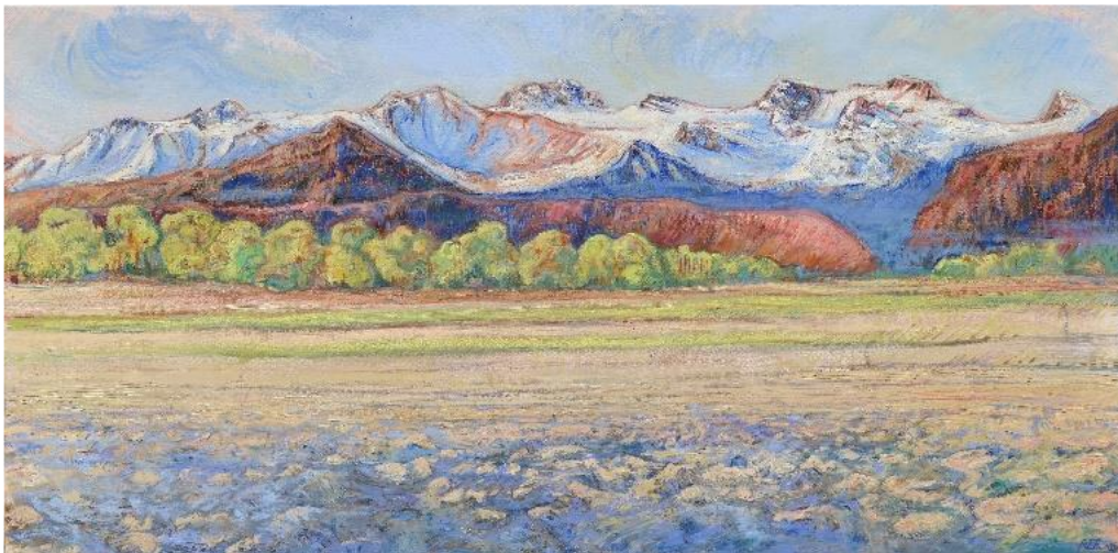
Le lendemain du Solstice, 2021, huile sur toile, 75x110 cm

La première série de peintures présentée à la Galerie Michael Lonsdale s'intitule "La Camminata". Elle est consacrée aux magnifiques paysages qui s'offraient à l'œil du peintre lors de ses pérégrinations entre Lucerne et St-Moritz, lieu de son enfance et de sa jeunesse. Les impressions saisies sur place ont donné naissance à des peintures d'un réalisme poétique qui reflètent, entre autres, les différentes facettes de l'eau, symbole du renouvellement de la vie.